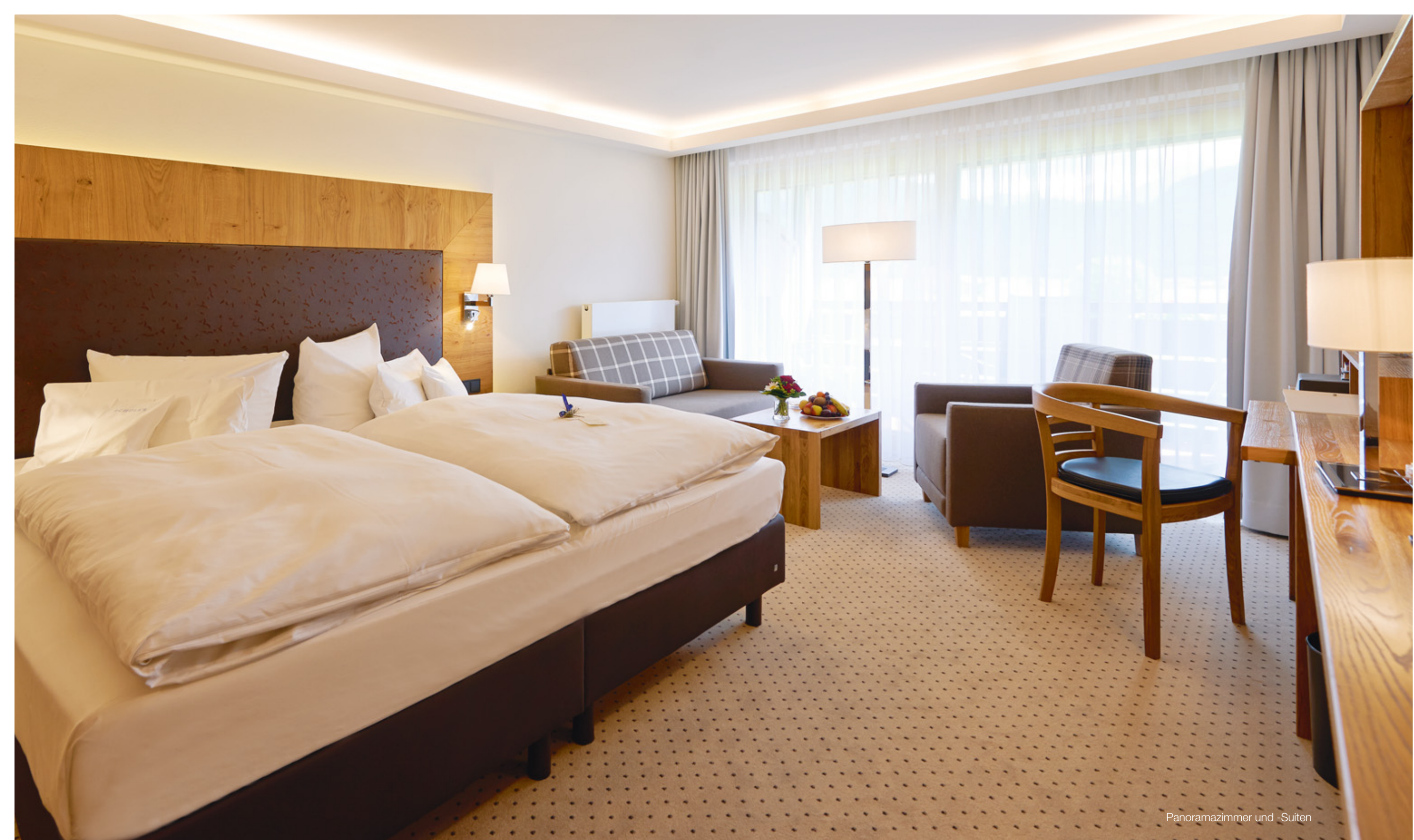
Panoramazimmer und -Suiten