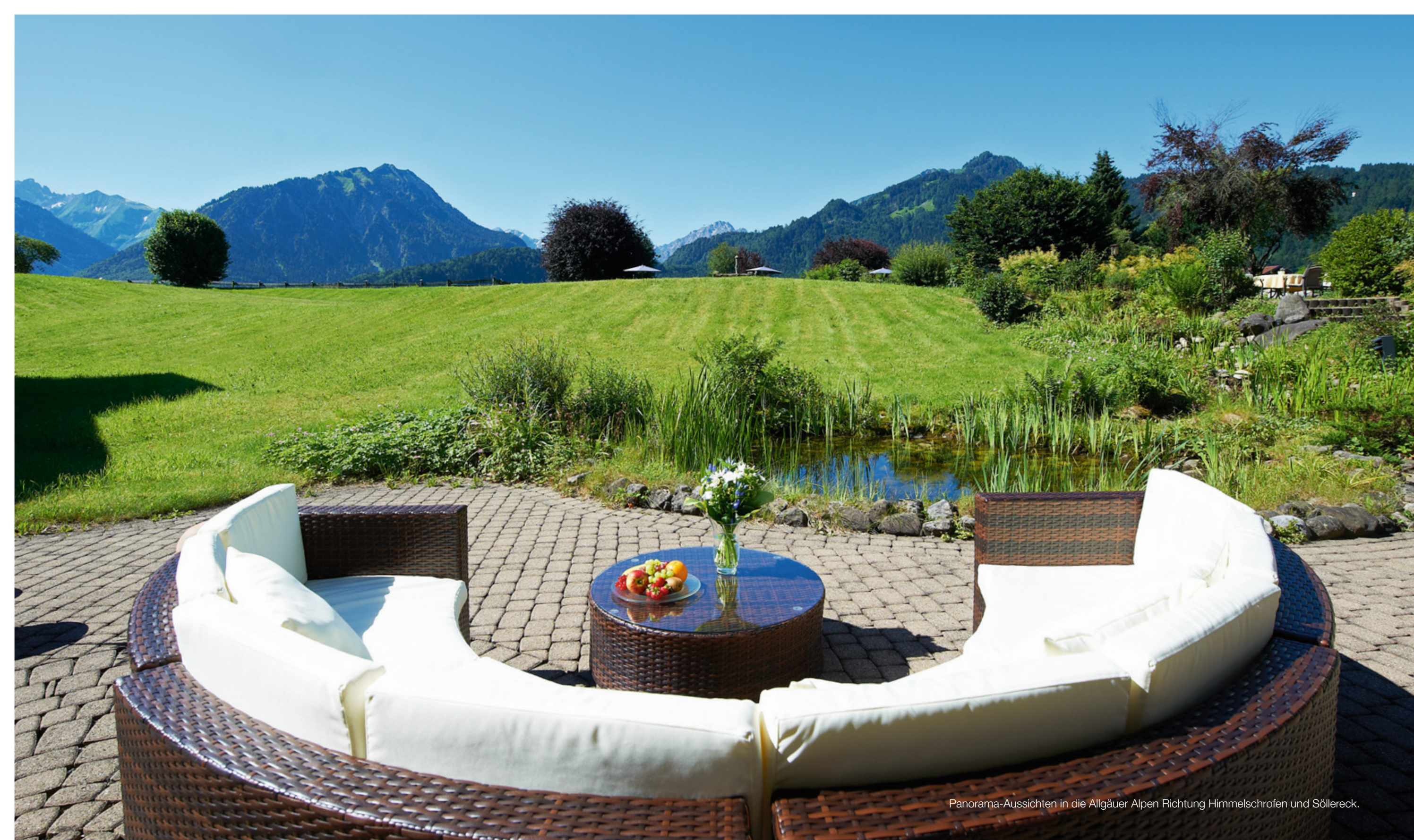
Panorama-Aussichten in die Allgäuer Alpen Richtung Himmelschrofen und Söllereck.