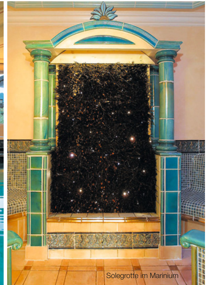
Solegrotte im Marinium

Ob Panorama-Hallenbad, Tepidarium, Aromagrotte, Caldarium oder Stubensauna. Ob Kaiserbad, Heubett mit frischem Allgäuer Bergheu oder Solegrotte – in SCHÜLE'S Marinium findet jeder seinen persönlichen Lieblingsplatz. Unsere gut ausgebildeten Wellness-Trainerinnen stehen Ihnen jederzeit gerne zur Seite.