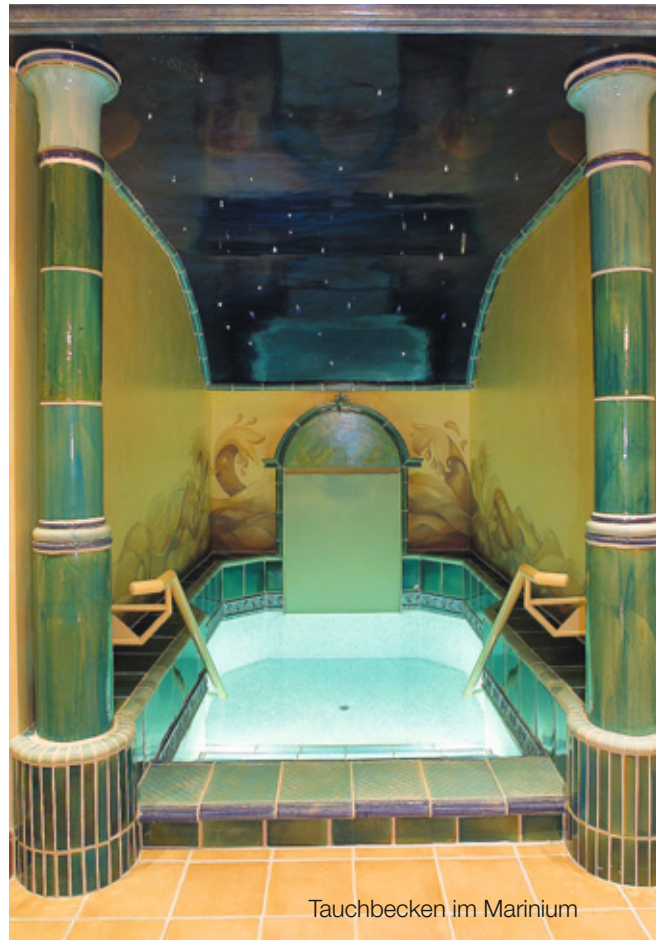
Tauchbecken im Marinium