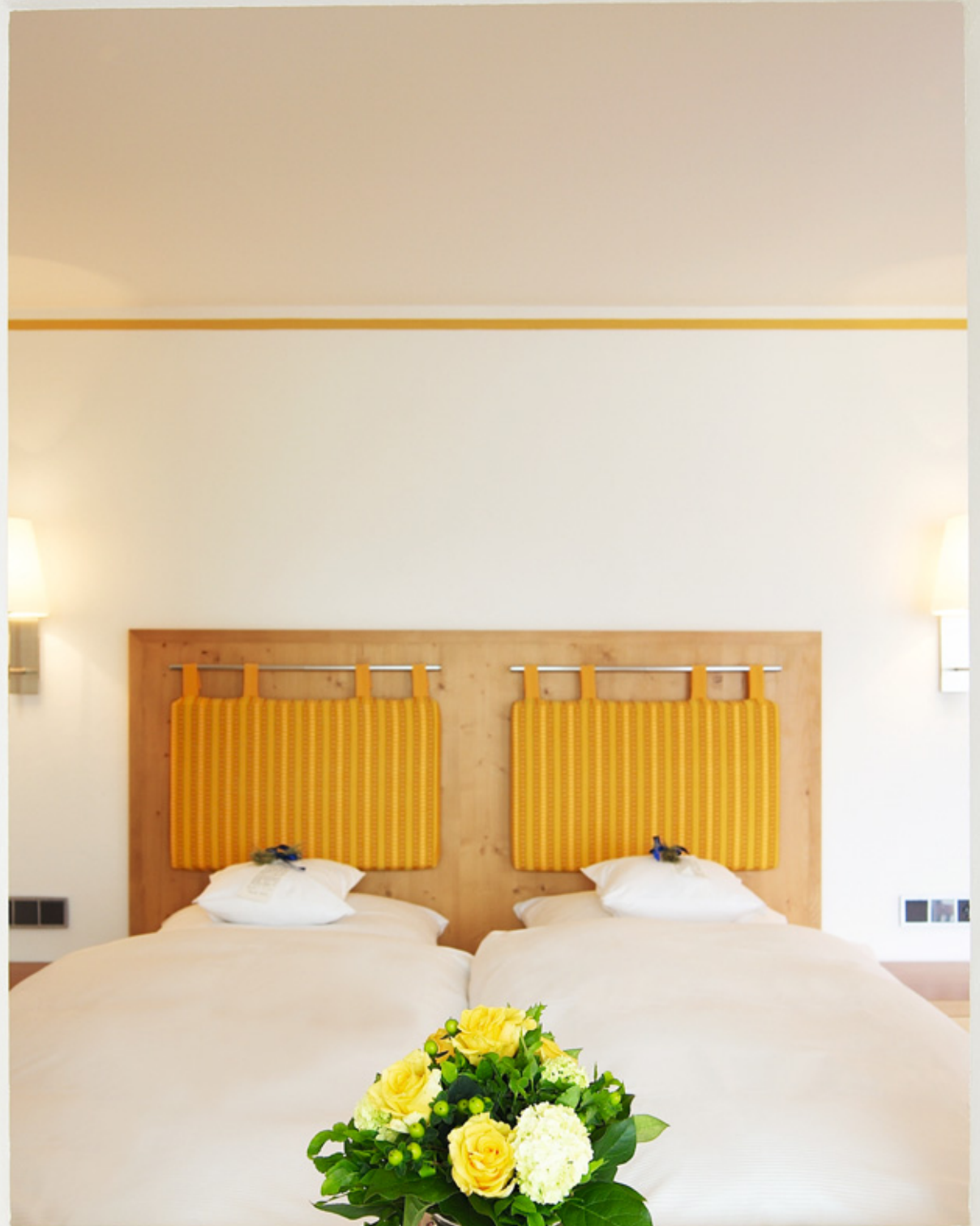
Zimmer „Heidelbeere“ mit Süd-Balkon.