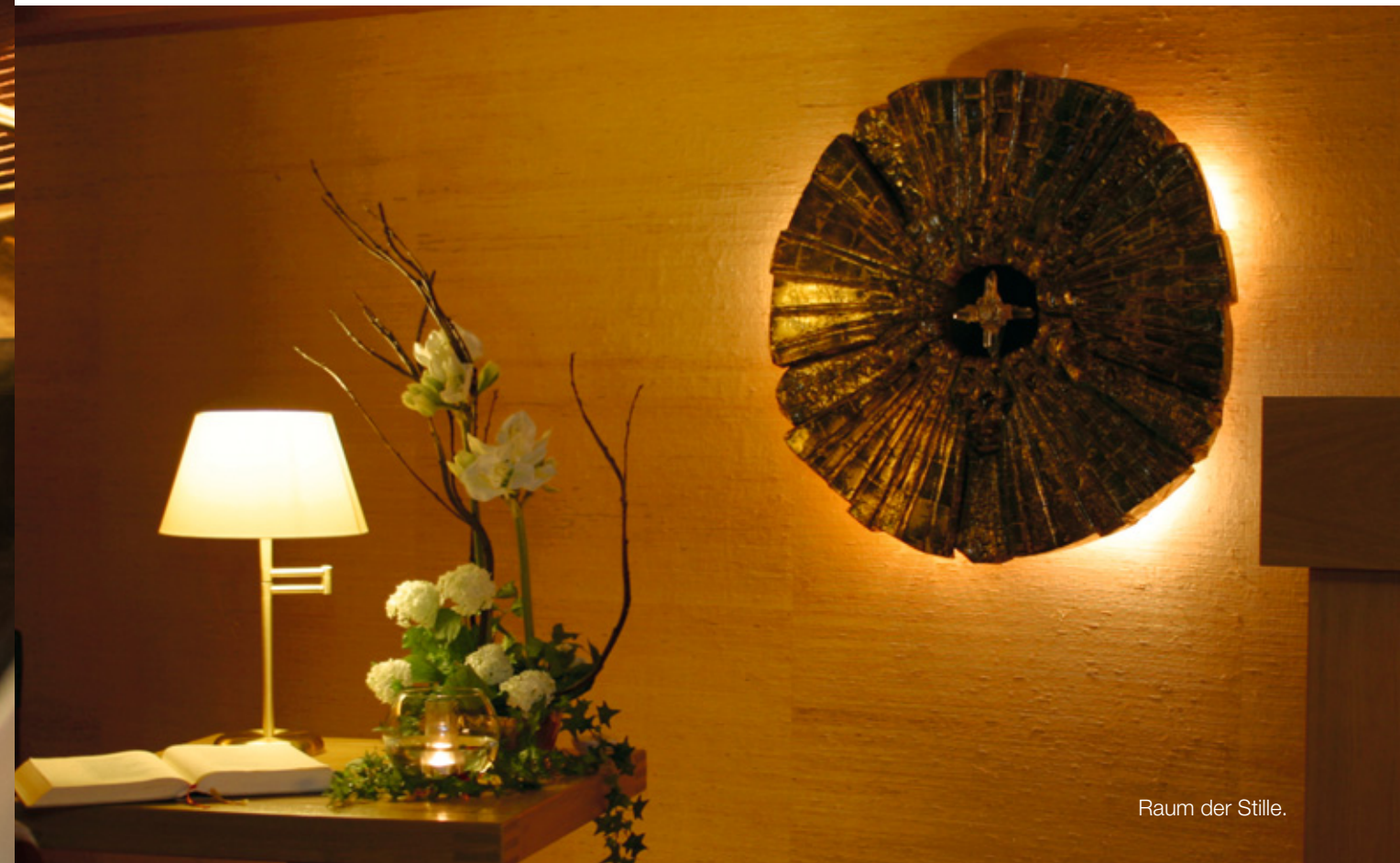
Raum der Stille.

Autorenlesungen, Musikkonzerte, Filmvorführungen (im Sommer Open-Air), Diabende oder interessante Vorträge. Lassen Sie sich durch neue Themen anregen und entdecken Sie, wie spannend und vielfältig das Leben ist. Das hält den Geist fit und Sie jung.